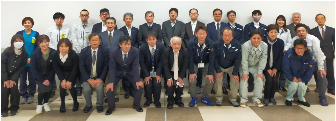
東振精機の皆さんもご一緒に参加者全員で写真撮影