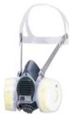
取替え式防じんマスク